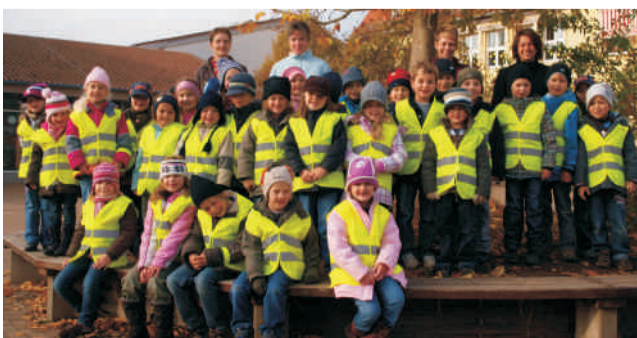
Erstklässler aus Pleinfeld....