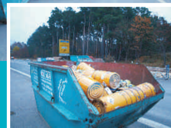
Großbaustelle an der B2