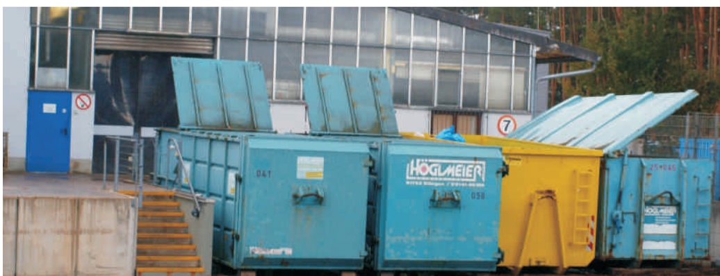
Seit Jahren entsorgt die Fa. Höglmeier Entsorgungs-GmbH für die Kiessling AG zuverlässig Kartonagen, Kunststoffe, Folien ...